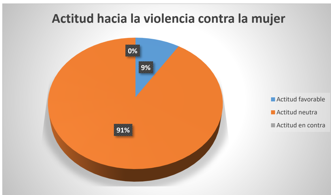
GRAFICA 1. ACTITUD DE LOS ESTUDIANTES FRENTE A LA VIOLENCIA CONTRA LA MUJER

Para establecer el punto de corte que ubica la actitud en los indicadores a favor, neutra o en contra se utilizó la función mediana en el programa Microsoft Excel 2016 identificando que la actitud a favor obtuvo una puntuación de 62 y la actitud en contra 54 puntos.